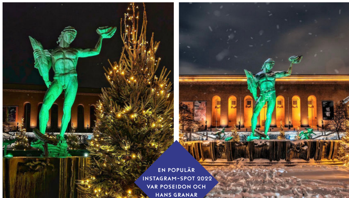
EN POPULÄR INSTAGRAM-SPOT 2022 VAR POSEIDON OCH HANS GRANAR

För att öka flödet till Avenyn och uppmärksamma bruncherna på gatan arrangerade vi under december månad adventskalendern Avenynglittrar. Adventskalendern bestod av fyra tävlingar med sponsrade priser från Boqerian, Isabelle, Joe Farrelli's samt City Aveny. Priserna bestod av tre presentkort från restaurangernas bruncher och en julklappskorg med julklappar från några av butikerna i City Aveny. Detta blev ett lyckat koncept och vi fick fram fyra vinnare.